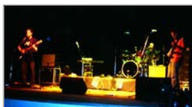
Minga, como en casa

-RAUCH | La Justicia actuó rápido -RAUCH | La Justicia ordenó suspender la poda -RAUCH | "Son cosas que pasan a nuestro lado" -RAUCH | Reclaman que cierren los prostíbulos